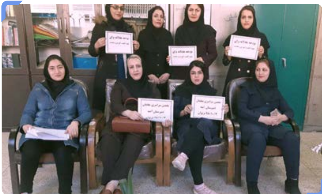
اعتصاب معلمان دبیرستان آمنه، مریوان

علی‌رغم اعلام همبستگی برخی از دانش‌آموزان با معلمان در جریان اعتصاب‌های آنها، اما یک جنبش مستقل دانش‌آموزی هنوز شکل نگرفته است. فعال شدن دانش‌آموزان به لحاظ صنفی و سیاسی، همسو با معلمان معترض، نقطه عطفی است که می‌تواند توزان قوا را به نفع یک نظام آموزش عادلانه و شایسته مطلقاً تغییر دهد.