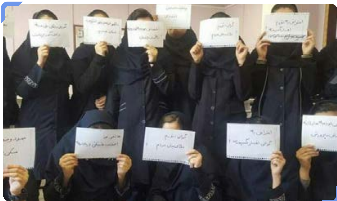
همبستگی دانش‌آموزان با معلمان در سومین دور تحصن سراسری آنها

در همین راستا، معلمان شاغل و بازنشسته از عرضه سهام صندوق ذخیره فرهنگیان در بورس نگران اند. پرداخت قسطی پاداش پایان خدمت نیز صدای معلمان بازنشسته را درآورده است.