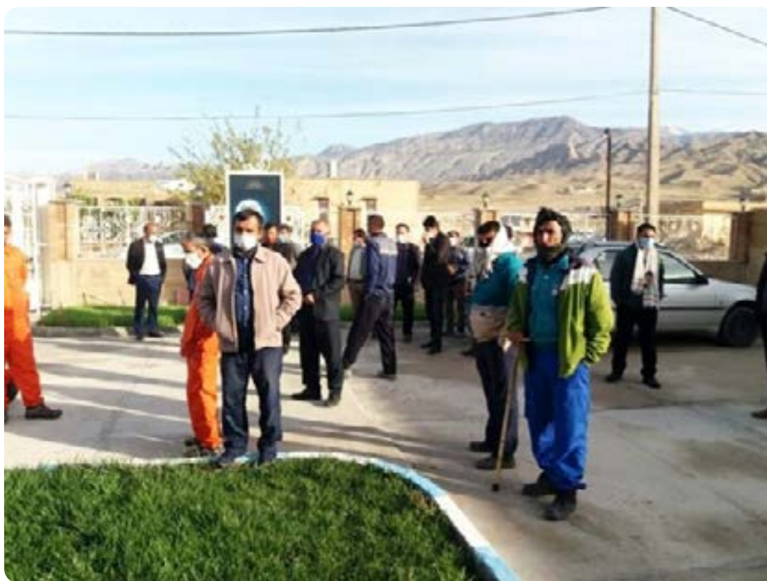
کارگران شهرداری صیدون در استان خوزستان هشت ماه است حقوق دریافت نکرده‌اند.

کارگران شهرداری در برخی مناطق ایران همچنان بدون وسایل حفاظتی در حالی که کرونا روز به روز شمار بیشتری را بیمار می‌کند، با حداقل دستمزد و شرایط کاری سخت مشغول به کارند. افزایش حجم زباله حجم کار کارگران را افزایش داده و خطر ابتلا به کرونا را برای آنان بیشتر کرده است. در تهران مدیرعامل «شهر سالم»، شرکت پیمانکاری وابسته به شهرداری تهران، از ابتلا ۲۳۰۰ تن از کارکنان شهرداری خبر داد. ۵۲ به گفته او از آغاز اعلام رسمی شیوع کرونا تا مهر امسال ۲۰۰۰ کارگر شهرداری تهران گرفتار این بیماری شده‌اند. ۵۳ در شاهین شهر و میمه، فرماندار این شهرستان گفت که ۱۵ نفر از کارکنان حمل و نقل شهری به کرونا مبتلا شده‌اند. ۵۴ در شهرداری رودان شش تن از کارگران خدمات شهری، در جویبار در استان مازنداران دو تن از کارگران بخش خدمات و آتش نشانی ۵۵ و در ارومیه ۸ تن از کارگران آرامستان رضوان شهر به این بیماری مبتلا شدند. ۵۶