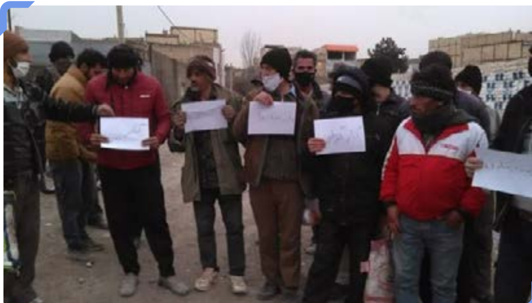
کارگران روزمزد در مشهد و سبزوار به نداشتن حمایت معیشتی اعتراض کردند.

بیکاری و فقر در ایران بیداد می‌کند. برپایه گزارش نهادهای حکومتی از هر چهار نفر جمعیت فعال اقتصادی در بهار امسال حدود یک نفر بیکار بودند. قیمت کالاهای اساسی و ضروری یک‌سال پس از افزایش ۲۰۰ درصدی نرخ بنزین در آبان ۱۳۹۸/نوامبر ۲۰۱۹ در برخی موارد ۲۰۰ درصد افزایش یافته است. حکومت از کنترل قیمت‌ها و تأمین کالاهای ضروری ناتوان است و دستمزد کارگران نهادهای عمومی و پروژه‌های نفت و گاز با تأخیر پرداخت می‌شود. اعتراض‌های کارگری به‌رغم همه‌گیری کرونا همچنان ادامه دارد. دولت امیدوار است با پیروزی جو بایدن در انتخابات ریاست جمهوری آمریکا باردیگر به توافق هسته‌ای و برجام بازگردد و بتواند با صادرات نفت بخشی از بحران اقتصادی را کنترل کند. جناح‌های حکومتی اما بر سر توافق هسته‌ای اختلاف نظر دارند. مجلس شورای اسلامی قانون اقدامات راهبردی برای پایان تحریم‌ها را که به موجب آن دولت موظف است حجم و غلظت اورانیوم غنی‌سازی شده را افزایش دهد، تصویب کرده است. ترور محسن فخری‌زاده، از مقامات ارشد برنامه هسته‌ای ایران که مقام‌های دولتی آن را به اسرائیل منسوب می‌کنند، تصویب این قانون را که می‌تواند به از سرگیری برنامه هسته‌ای ایران و تشدید تحریم‌ها بیانجامد، برای مجلس تسهیل کرد.