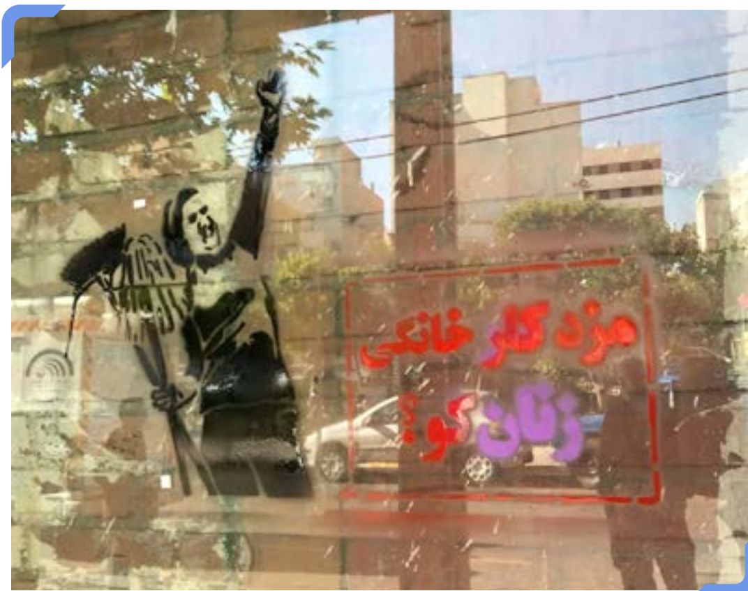
طرح گرافیکی در اعتراض به کار خانگی بدون مزد زنان

در همین دوره زمانی یک ساله بیش از ۹۱۰ هزار نفر از جمعیت شاغلان و فعالان اقتصادی کاسته شد. مرکز پژوهش‌های مجلس شورای اسلامی در یک گزارش «دلسردی و ناامیدی از یافتن کار» را علت اصلی «خروج» جویندگان کار از بازار کار اعلام کرد.