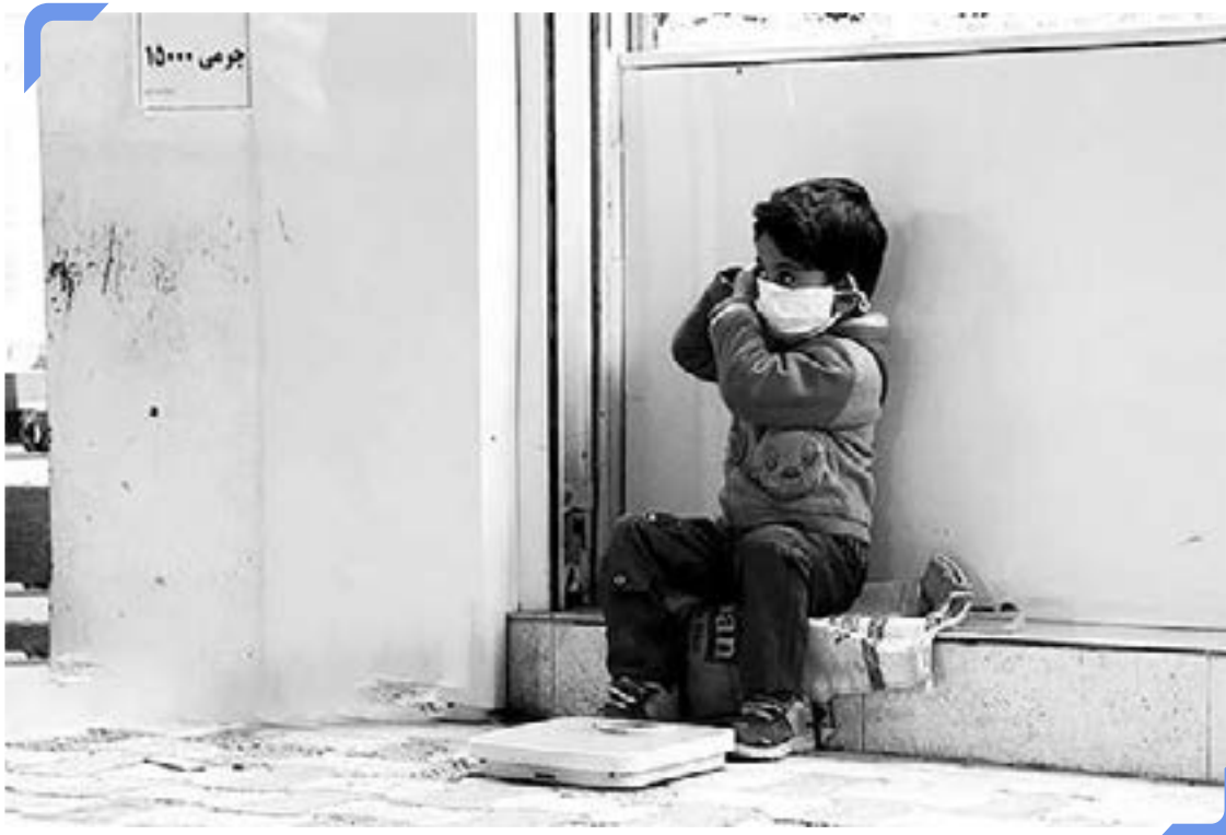
شمار کودکان کار در دوره کرونا افزایش یافت.

آمار دقیقی از شمار کودکان کار وجود ندارد. آخرین بار وزارت کار در سال ۱۳۹۸ شمار کودکان کار را حدود ۵۰۰ هزار نفر اعلام کرد. فعالان حقوق کودک اما از اشتغال بیش از چهار میلیون کودک خبر می‌دهند. بیشتر کودکان کار در بخش جمع‌آوری زباله، کارگاه‌های تفکیک زباله، دستفروشی و کارگاه‌های ساختمانی کار می‌کنند.