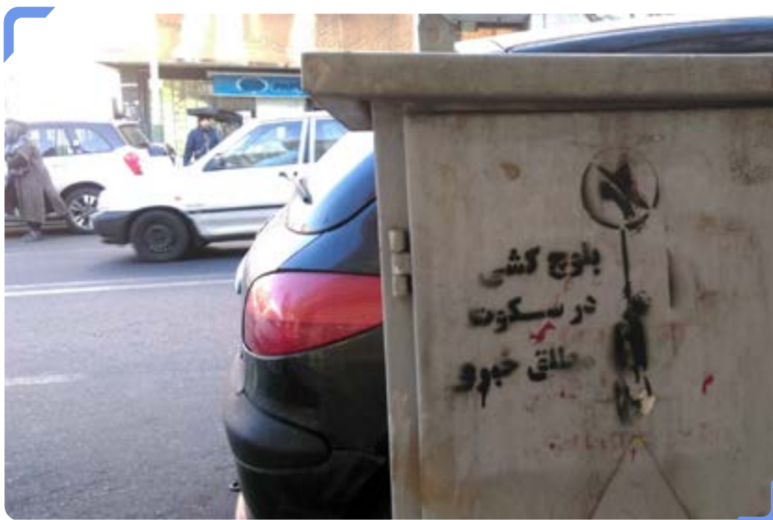
طرح گرافیکی در اعتراض به کشتار بلوچ‌ها در ایران

در یک سال گذشته، دستکم ۴۵ کولبر کشته و ۱۱۸ تن زخمی شدند. شلیک ماموران مرزبانی عامل مرگ ۳۷ کولبر بود و ۸ تن دیگر بر اثر سرمازدگی، سقوط از ارتفاع و یا انفجار مین جان باختند.