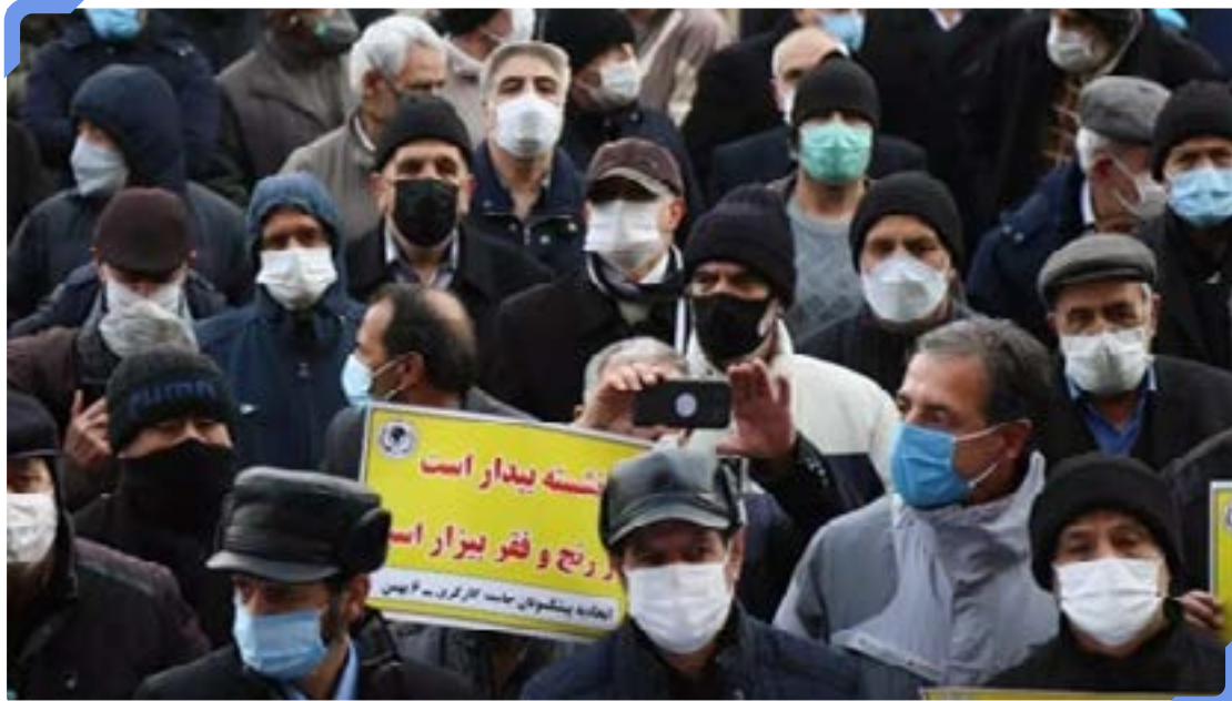
بازنشستگان در یک سال گذشته بارها به خیابان آمدند.

از هر ۱۰ بازنشسته ۶ نفر حداقل بگیرند و حقوق ماهانه کمتر از ۲,۸ میلیون تومان دریافت می‌کنند. اجرای قانون همسان‌سازی حقوق بازنشستگان به دلیل آنچه که کسری بودجه و کمبود منابع عنوان می‌شد تا تابستان سال گذشته به تاخیر افتاد. در تابستان سرانجام وزارت تعاون، کار و رفاه اجتماعی و صندوق بازنشستگی تأمین اجتماعی اعلام کردند همسان‌سازی حقوق بازنشستگان را ذیل عنوان متناسب‌سازی اجرا کرده‌اند.