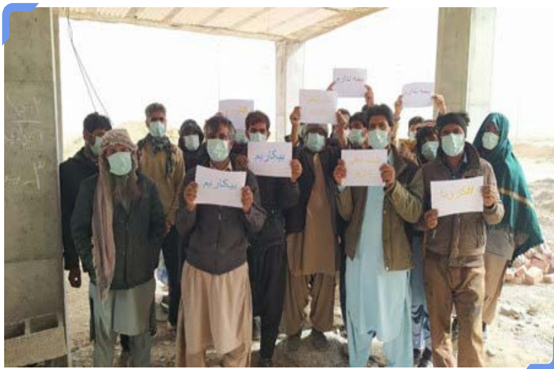
تجمع کارگران روزمزد زاهدان

بسیاری از بیکارشدگان، شاغلان در مشاغل خانگی، کارگاه‌های کوچک، کارگران فصلی، دستفروشان، به همراه بخش بزرگی از شاغلان بخش خدمات در رستوران‌ها، فروشگاه‌های لباس، خدمات گردشگری و ... مشمول دریافت خدمات اجتماعی و بیمه بیکاری نشدند. بر اساس اعلام وزارت تعاون، کار و رفاه اجتماعی تا پایان سال ۱۳۹۹ تنها به ۶۷۰ هزار نفر از بیکارشدگان بر اثر کرونا مقرری بیمه بیکاری به مدت سه ماه پرداخت شد. ۱۰ این در حالی بود که معاون وزیر صنعت، تجارت و معدن در شهریور ۱۳۹۹ شمار افرادی را که برای دریافت بیمه بیکاری ثبت‌نام کرده بودند یک میلیون و ۷۰۰ هزار نفر اعلام کرد. ۱۱