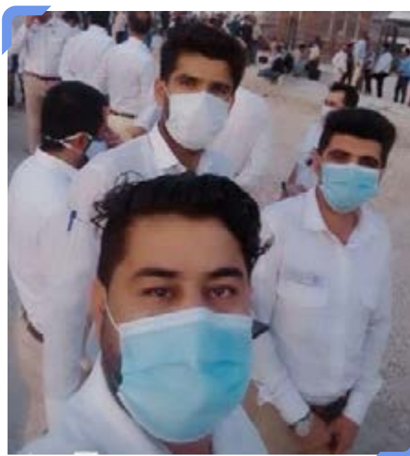
گروهی از کارگران اعتصابی کنگان

اصلی‌ترین مطالبه‌ی کارگران عبارت است از انعقاد قرارداد مستقیم با خود کارفرمای دولتی و حذف شرکت‌های پیمانکاری واسطه - دست کم حذف پیمانکاران دست‌دوم - در بخش خصوصی.